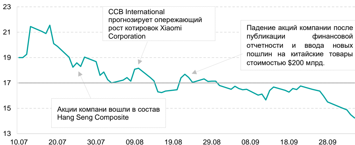
График 1. Динамика стоимости акций Xiaomi Corporation

Одним из самых ожидаемых и крупнейших IPO этого года стало размещение китайского производителя электроники Xiaomi Corporation на Гонконгской бирже. 9 июля начались торги акциями компании, цена размещения составила 17 HKD. По итогам размещения капитализация одного из лидеров рынка смартфонов достигла $54 млрд. при объеме размещения в $4,72 млрд. 18 июля 2018 года акции Xiaomi достигли максимальной стоимости в 21,55 HKD. На протяжении первых 7 торговых сессий бумаги производителя электроники показывали преимущественно восходящий тренд. Однако впоследствии акции компании начали снижаться вслед за основным индексом Гонконгской биржи – Hang Seng на фоне конфронтации КНР и США в сфере международной торговли.