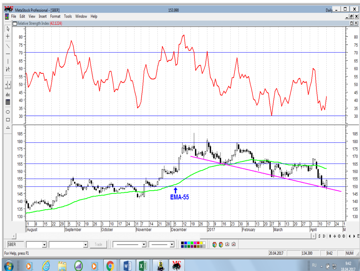
График акций Сбербанка

* Акции для сравнения с Портфелем УТ в прошлом цикле считаются купленными по средневзвешенным ценам 04.04.2017 г.